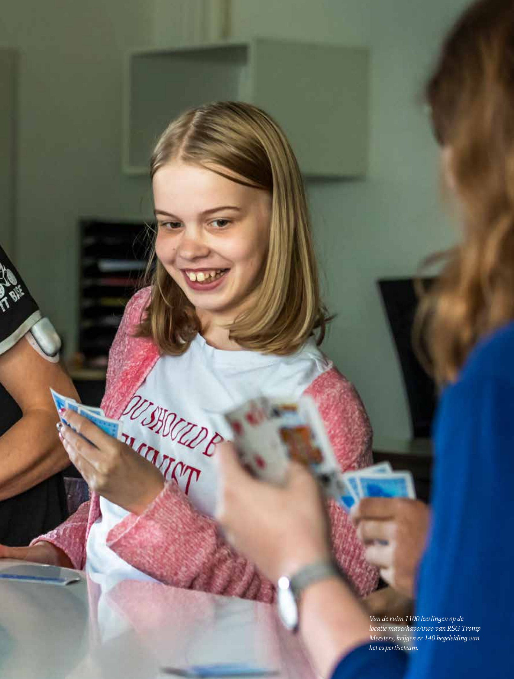
Van de ruim 1100 leerlingen op de locatie mavo/havo/vwo van RSG Tromp Meesters, krijgen er 140 begeleiding van het expertiseteam.