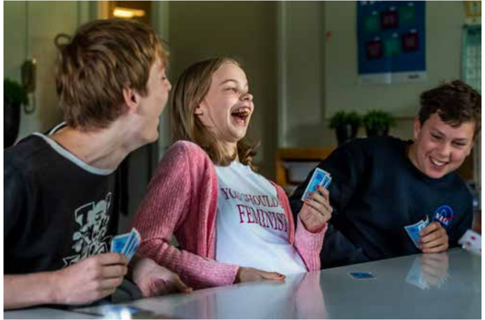
Er zijn leerlingen die vijf keer per dag bij het expertisecentrum komen, maar er zijn er ook die voldoende hebben aan één keer in de week.